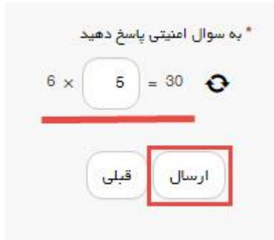
تصویر ۴-سوال امنیتی

سپس به سوال امنیتی پاسخ داده و بر روی دکمه ارسال کلیک کنید.(تصویر ۴)