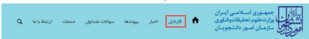
تصویر ۸- کارتابل شخصی

با دریافت پیغام جهت مراجعه به پورتال، برای مشاهده وضعیت خود اقدام نمایید. از طریق پورتال سازمان امور دانشجویان سربرگ کارتابل را انتخاب نمایید. (تصویر ۸)